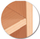
Chants polypropylène (PP) de 2 mm

Ne pas utiliser: Solvant cétonique; Pâtes et crèmes abrasives; Détergents (ne pas gratter).