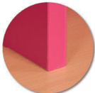
Séparation(s) verticale(s) en mélaminé ép: 19mm chant polypropylène (PP) de 2 mm.