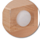
Embouts non tachants et non marquants (polyéthylène).