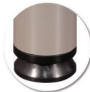
Vérins de réglage