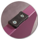
Embouts non tachants et non marquants (polyéthylène).