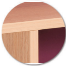
Chants polypropylène (PP) de 2 mm