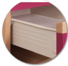
Tiroir sur glissière métalliques