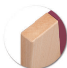
finition verni polyuréthane.