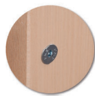
Assemblage tourillons et vis relieurs