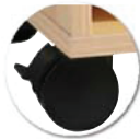
Roulettes double galets