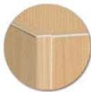
Chants polypropylène (PP) de 2 mm