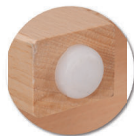
Embouts non tachants et non marquants (polyéthylène).