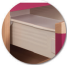
Tiroir sur glissière métalliques