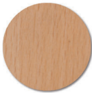
finition verni polyuréthane.

Ne pas utiliser: Solvant cétonique; Pâtes et crèmes abrasives; Détergents (ne pas gratter).